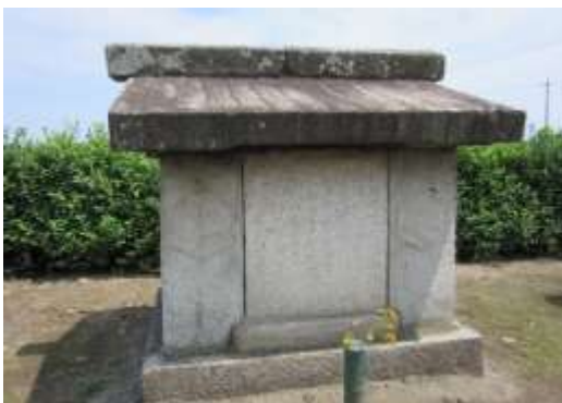
生駒利豊の家型廟

*生駒周房……彼の代の時領地が加増されて4,000石となった。また、生駒家として尾張藩家老になった人。江戸詰の際には元高松藩主とも親交を深めた。