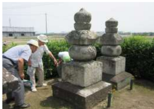
四代家長夫妻の五輪の塔