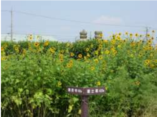
花に囲まれた墓地

富士塚を後にして大型バスは田んぼ道?を走り、狭い道で切り返しを行いながらやっとの思いで右折する。すると車内からは思わず拍手が沸いた、さすがプロの運転手。10分程で到着しバスを降りると、目の前に小さいヒマワリ?がたくさん咲き誇っている。そのヒマワリの花の上にちょこんと二つ墓石がのぞいているのが見えた。