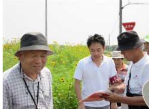
中央が生駒家の子孫の方

入口には教育委員会の説明板があり、隣には写真入りで「生駒家の宝頂山墓地・墓石配置と碑文案内」の説明板もあった。ガイドさんが話しを始めるとすぐに一人の若い男性を紹介した、サンダル履きのいでたちの青年はこの生駒家19代のご子息とのこと。腕には歴史ガイドの腕章をつけている、その青年が説明を始めるとはっきりした口調で分かりやすい、話の端々からはこの地域の歴史を研究しているらしいことがうかがえる。