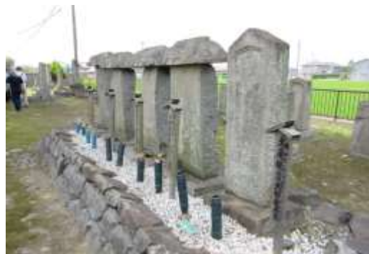
手前が吉乃の方の墓