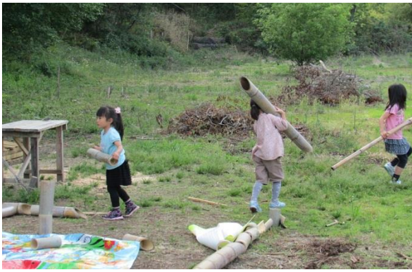
竹の搬出、草刈り、水田の代かきなどの作業をしました。

桜が咲き誇る季節が過ぎ、さまざまな色の緑を楽しめる美しい季節がやってきました。自然環境学習の森では、5月の連休を利用して多くの方が訪れ、竹の搬出や草刈りなどの活動に参加されました。